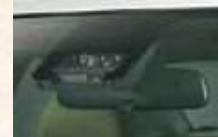
トヨタ・セーフティー・センスC